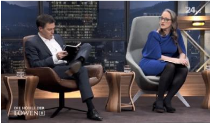
Beispiel Product-Placement Premium

Das Produkt wird in kurzen Sequenzen (z.B. 3x10 Sekunden) auf natürliche Weise in den Handlungsablauf der Sendung integriert.