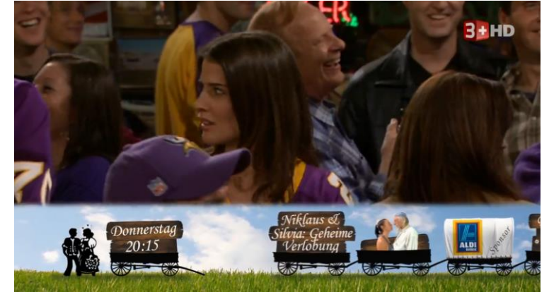
«Bauer, ledig, sucht...», Sender 3+, Bewegtbild nicht vorhanden

Das Format wird während einer anderen Sendung (Serienumfeld) beworben. Der Hauptsponsor erhält eine exklusive Logopräsenz auf dem Promo-Cut In. Die Integration erfolgt in enger Absprache mit dem Sender und innerhalb des zulässigen werberechtlichen Rahmens.