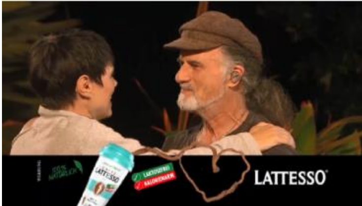
«Sing meinen Song – Das Schweizer Tauschkonzert», Sender TV24

Umfeldplatzierte Cut Ins sind eine sehr effektive und kosteneffiziente Sonderwerbform. Die Werbebotschaft wird direkt im kontextuell passenden Umfeld platziert. Der Bezug zwischen der Handlung und dem Produktnutzen wird hergestellt und die Werbebotschaft bleibt besser in Erinnerung.